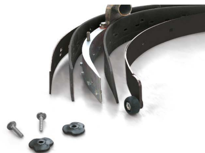
Vispa 35 E-B-BS Per ottenere una buona asciugatura è necessario mantenere sempre pulite le gomme tergilavaggio. La loro sostituzione in caso di usura risulta essere molto semplice