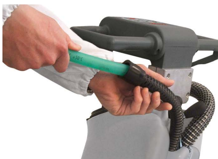
Vispa 35 B-BS Pulizia periodica del tubo tergilavaggio per garantire un'efficiente aspirazione