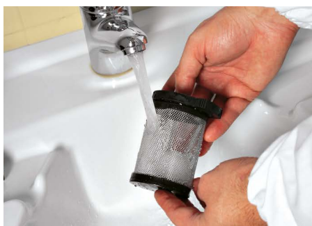
Vispa 35 E-B-BS Pulizia totale del filtro di aspirazione semplice e pratica